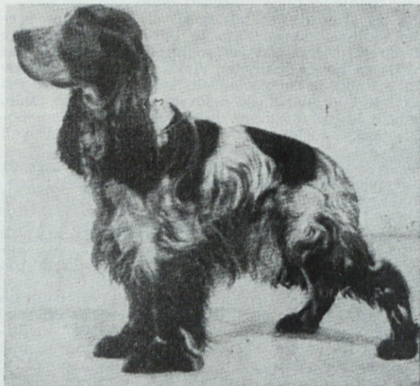
Koker španjel Silverdawn Dainty 70207/56 — prvak Evrope 1964