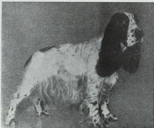
Koker španjelka Medina von Schölerberg 3874/58 — prvakinja Evrope 1964

Vsak pes je dobil poleg diplome še znak za oceno (belordeči trak je pomenil odlično oceno, beli prav dobro, rdeči dobro — vsi redi so bili natisnjeni s pozlačenimi črkami), vsak razstavljalec je pa dobil za vsakega psa tudi spominski znak. Prijavnina za vsakega psa je znašala 26 frankov, kar znese okroglo 4500 dinarjev, katalog pa je veljal 2 franka, okroglo 350 dinarjev.