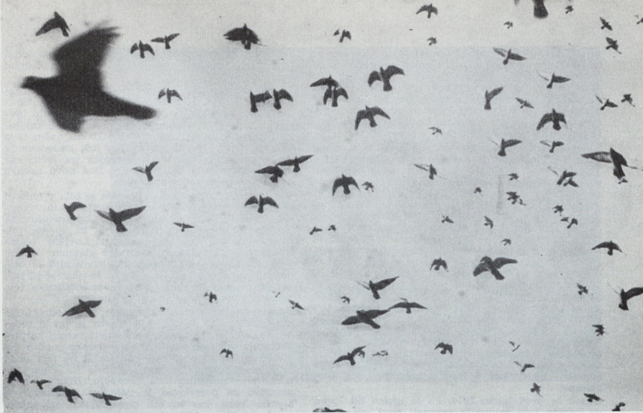
Divji golobi se vračajo