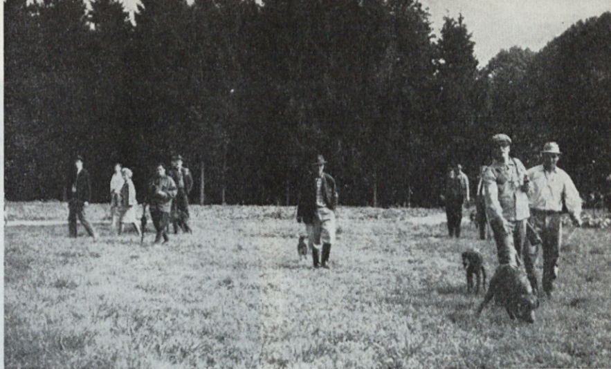
S tekme ptičarjev med klubom ptičarjev iz Padove in DLP iz Ljubljane, 24. sept. 1964

V dneh te mednarodne razstave je bilo tudi posvetovanje lovcev s Koroške, Štajerske, iz Italije in