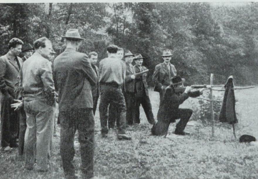
LD Muta ob Dravi, strelske vaje z malokalibrsko puško