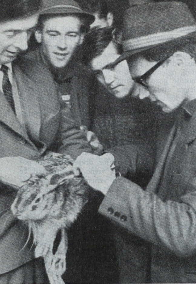
Veterinar markira zajce