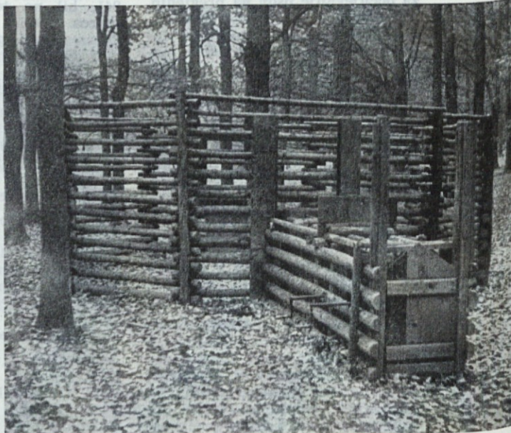
Lovilnica za divje prašiče v lovišču Ponješice

šiče, muflone in damjake. Osebo me je zanimala gojitev divjih prašičev, ki jih intenzivno goje v posebni obori z 200 hektari. Jesenski stalež prašičev, to je pred pričetkom lova, znaša 120, vsakoletni odstrel pa 60 kosov. Gojitev je poudarjena predvsem z izredno točno vodeno statistiko po starostnih razredih. Prašiči so tu vezani le na umetno prehrano, saj jih krmijo dvakrat dnevno. Razen tega je v obori tudi nekaj krmnih njiv, posajenih s krompirjem, topinamburjem in koruzo, kar pa za prehrano tolikšnega števila divjadi jasno ne zadošča. To lovišče me je spominjalo na farmsko vzrejo bekonov. Pra-