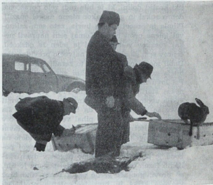
Spušcanje zajcev na Ljubljanskem polju