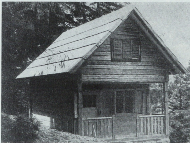
Lovska koč na Rogatcu, LD Luče

Lovišče obsega 6400 ha, glavna divjad je srnjad. V višjih legah, predvsem na Raduhi in Rogatcu,