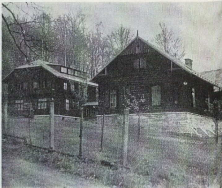
Lovski dom v lovišču »Stara obora«

V naslednjih dneh smo obiskali dvojce res vzornih lovišč in sicer: 1. Stara obora. Lovišče meri 1570 ha, s pretežno starejšimi mešanimi gozdovi jelke, smreke, hrasta in bukve. V tem lovišču goje divje pra-