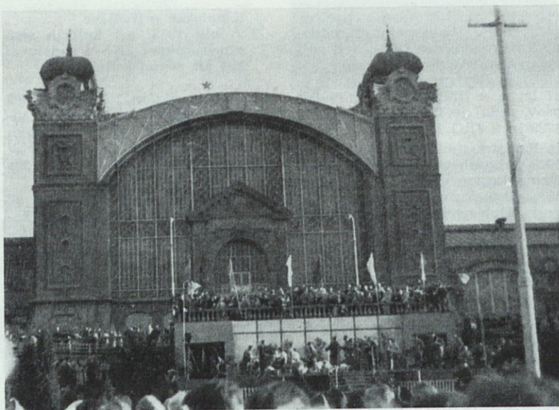
Razstavní paviljon v kulturnem parku Fučík v Prazi