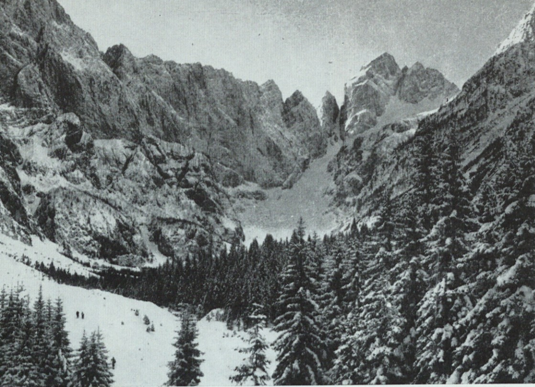
Domovanje planinskega orla

skobacajo na zunanji rob gnezda, da ne bi onesnažili doma. Na ta način gnezdo ni nikdar »pobeljeno« od iztrebkov, kot se to dogaja pri vranah.