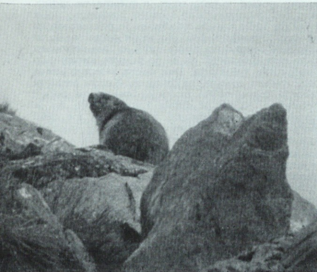
Švizec je zaslutil nevarnost

Takega je moral videti tisti, ki mu je prvemu prišlo na um, da uporabi njegovo podobo kot simbol moči in nepremagljivosti.