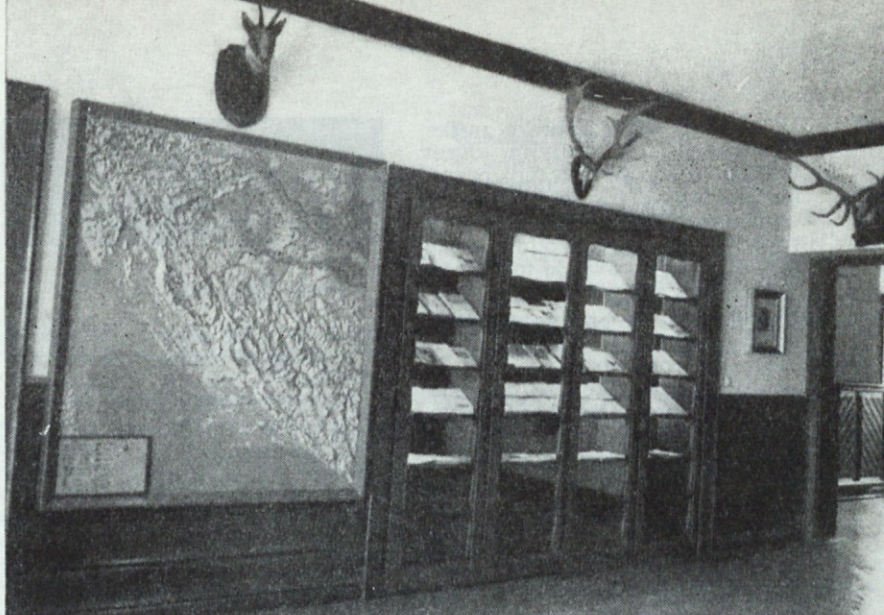
V zagrebškem lovskem muzeju

V lovskem letu 1964/65 je vseh 58 lovskih družin Lovske zveze Maribor sprejelo svoje nove družinske poslovniške. V poslovnihkih je točno predvideno, kako se zbirajo sredstva v družini in kako se lahko uporabljajo. Po načelu, da se vsa sredstva, pridobljena iz lovišča, zopet vračajo v lovišča, poslovniški predpisujejo ob koncu vsakega lovskega leta natančen obračun in ugotovitev dohodka ter razdelitev tega na sklade. Razmerje v odstotkih za sklade določijo vsako leto občni zbor lovske družine. Da bi lahko dobili pregled nad posameznimi skladi in naredili ustrezno analizo, kako posamezne lovske družine gospodarijo, je upravni odbor Lovske zveze Maribor na svoji seji dne 27. 10. 1965 med drugim sklenil, da se z vsemi družinskimi blagajniki organizirajo tozadevni razgovori, da bi družine vodile po poslovnihkih enotno finančno politiko. Taki sestanki so bili v marcu 1966. V ta namen je bil pripravljen poseben obrazec za ugotavljanje čistega dohodka družine ter delitev tega na sklade. Celotno področje Lovske zveze Maribor je