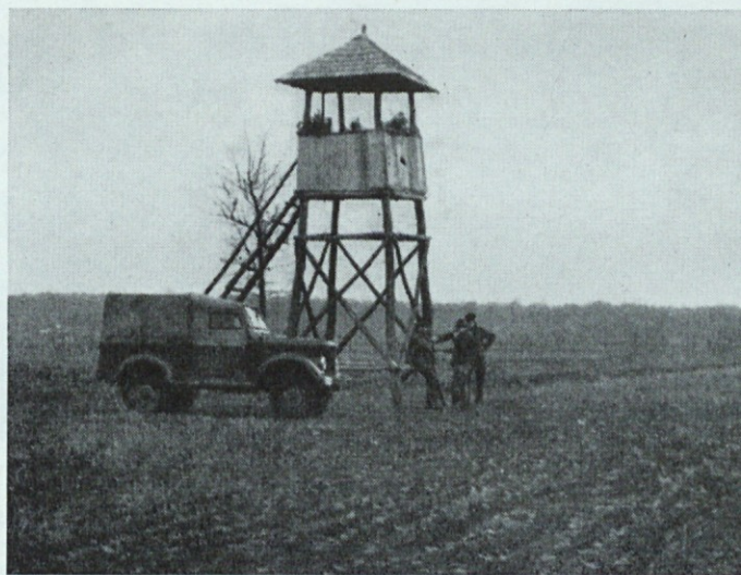
Motiv iz romunskega lovišča

ne opravljajo, morajo plačati. Zanimivo je, da so si vsi na jasnem, da lovska organizacija lahko rentabilno posluje samo zaradi brezplačnega sodelovanja članstva, medtem ko morajo državna lovišča dobivati izdatne dotacije. Pred tem dejstvom mnogi pri nas še vedno zatiskajo oči in sanjajo o nekakšnih lovskih podjetjih.