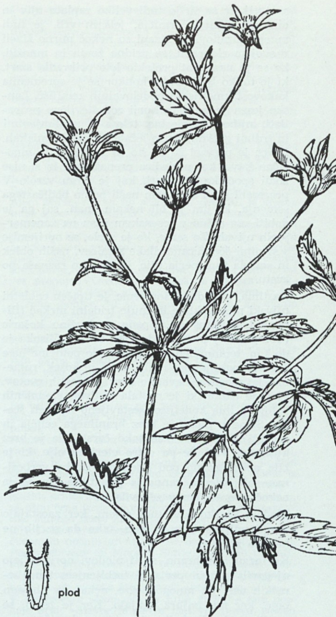
Tridelni mrkač ( Bidens tripartita L.)