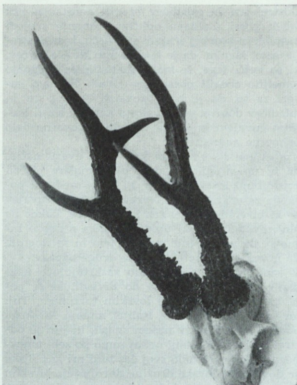
Na Turnišču, LD Ptuj, 8. jul. 1965 uplenjena trofeja, teža 510 g, 148,55 točke. Uplenitelj Slavko Jesenko, Ptuj