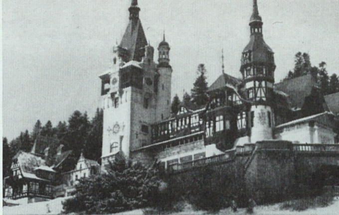
Bivši lovski dvorec romunskih kraljev, sedaj muzej

Člani imajo poleg plačevanja članarine tudi dolžnosti pri uničevanju škodljivcev, nadzoru v lovišču in gojitvenih delih. Kolikor te dolžnosti