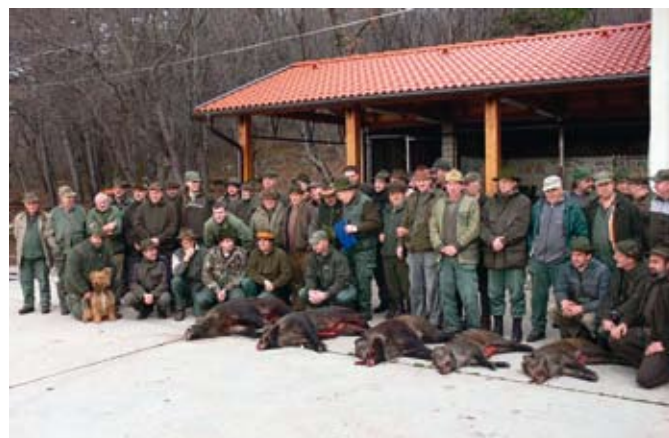
Člani Društva slovenskih lovcev F - JK - Doberdob in LD Videž - Kozina ob plenu skupnega lova

Za dobro razpoloženje je poskrbel lovski krst dveh mladih lovcev.