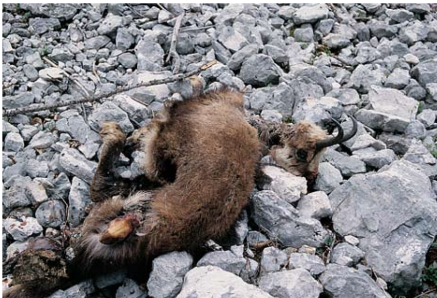
TNP: Garje – pogin