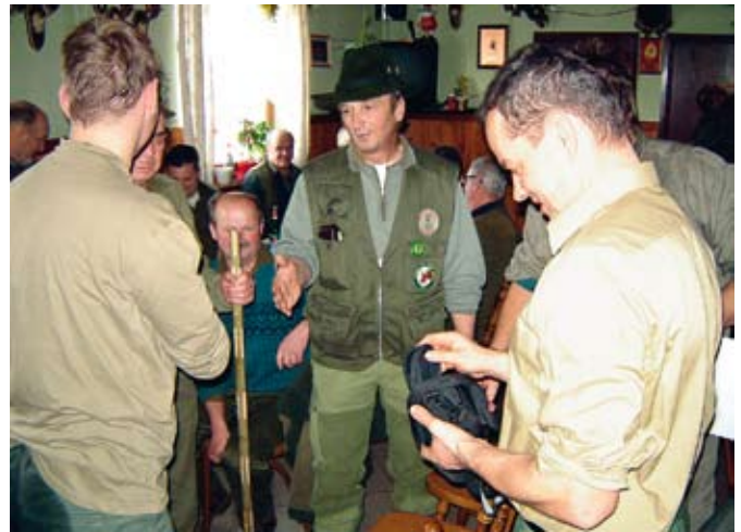
Lovski krst: »obtoženec« pred »sodnim senatom«

nih odstopanj od običajev domače LD, razlika je bila le v kaznovanju, med katerim je krščenec ležal v dveh položajih. Najprej so ga namreč polegali na hrbet. V usta so mu vtaknili cev, ki je imela na drugi strani lijak, v katerega je »rabelj« vlival vino. Ko je ocenil, da je »obsojenče-