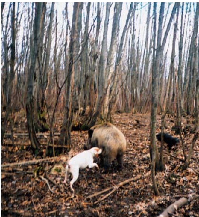
Ustavljanje ranjenega divjega prašiča

Po žrebanju vodnikov psov goničev je vse prisotne pozdravil predstavnik LD Idrija Franc