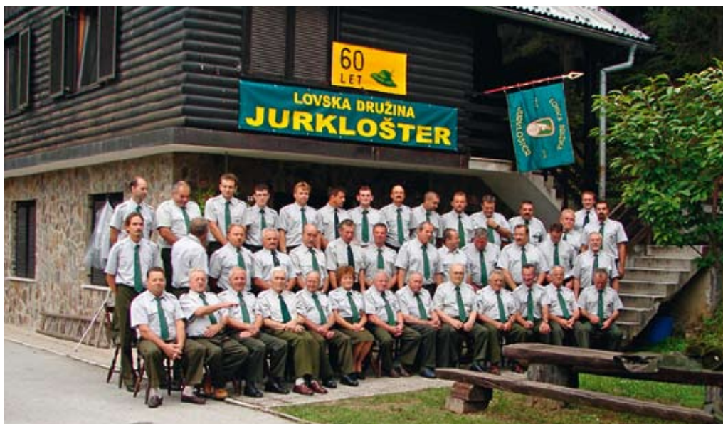
Jubilejna fotografija članov LD Jurklošter, ki so lani praznovali okrogli jubilej.

Vsako jesen s svojimi prijatelji priredijo lov na divje prašiče iz vse Slovenije. Tisti dan je zares pravo doživetje v druženju, izmenjavi mnenj, dobrih idej, navsvetov in predvsem poglobljanju