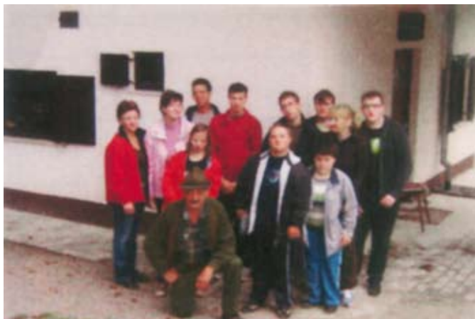
Še skupinska fotografija pri domu na Pajkežu