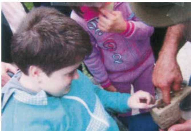
A tako deluje past za polhe?