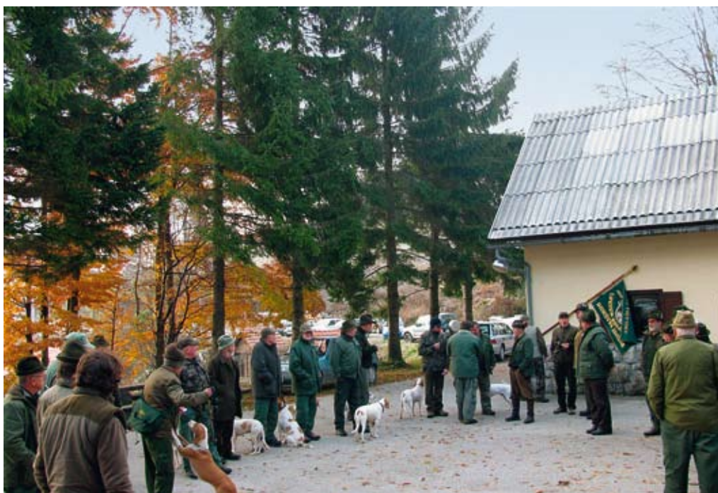
S spominskega lokalnega (Memorial Antona Oselija) tekmovanja visokonogih goničev na Vojskem