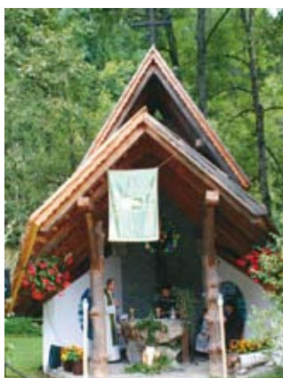
Hubertova maša je bila v kapelici v Bistriškem jarku (LD Muta).

Po izredno deževni soboti smo se zbudili v sveže oprano jutro, nedeljo 30. avgusta, ko je sonce preganjalo še zadnje meglice iz dolin in globač; tudi iz doline z imenom Bistriški jarek. Tja, ob kapelico sv. Frančiška Asiškega so se tisto dopoldne namenili mnogi kmetje z območja našega lovišča, mnogi prijatelji lovstva in seveda lovci. Zavidanja vredna udeležba. In kje naj bi se bili zbrali ob takšni priložnosti, če ne ravno ob kapelici, ki je bila postavljena kot spomin in opomin ob zgraditvi vodne akumulacije Koralpe na avstrijski strani, ki je s svojo velikansko količino vode stalna grožnja celotni dolini Bistriškega jarka in še dlje v dravsko dolino. Na to nevarnost nas na vsakem koraku opozarja-