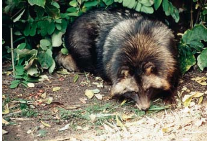
Rakunasti pes – Nyctereutes procyonoides

Znano je, da je rakunasti pes (imenovan tudi enok) do- moroden v območjih vzhod- ne Azije in da so ga umetno vnesli (v letih 1930–1950) na farme za vzrejo teh kožuhar-jev v zahodne predele nekda- nje Sovjetske zveze, od ko- der so živali pobegnile, se razmnožile in razširjale. Pred nedavnim je bila ta vrsta srednje velike zveri iz druž- ine psov (Canidae) uvrščena na spisek DASIE (t. j. spisek najbolj škodljivih invaziv- nih vrst v Evropi (glej: www.europe-aliens.org/species/TheWorst.do ). Odkrili so, da rakunasti pes povzroča mate- rialno ekološko škodo med domorodnim živalstvom na 1,4 milijona km 2 ozemlja, kar je skoraj drugotno širjenje v Evropi. Prav tako je ta vrsta ena od pglavitnih prena- šalk (vektorjev) gozdne ste- kline v Evropi, pa tudi po- membena prenašalka garij in tudi za človeka lahko smrtno nevarne lisičje traku- lje ( Echinococcus multilocularis ). Na Švedskem si potek projekta rakunasti pes lahko ogleda tudi javnost prek spleta, kjer si lahko ogledu- jejo posnetke živali. Le-te so