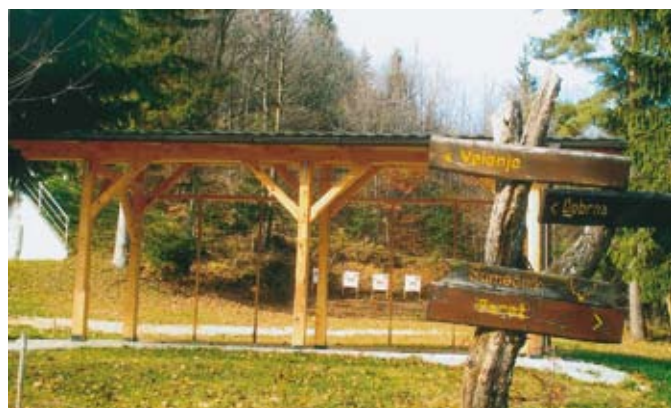
Strelišče za streljanje z MK puško LD Dobrna