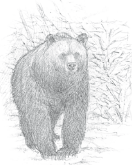
Narisal: U. Ift