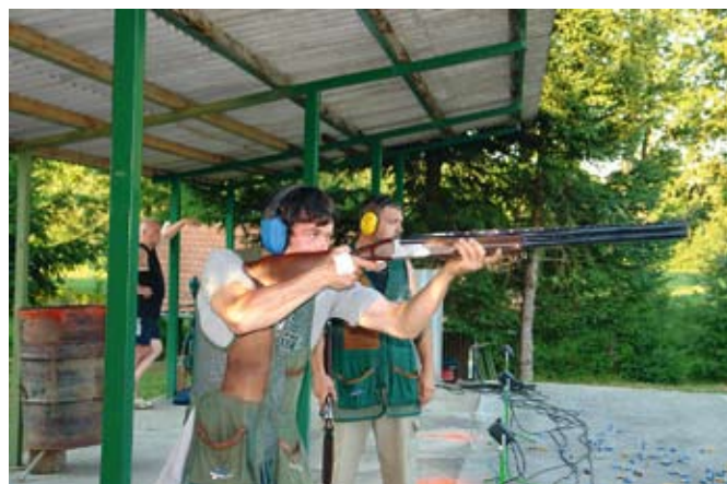
Odlični strelci so kot za stavo zadevali glinaste golobe.