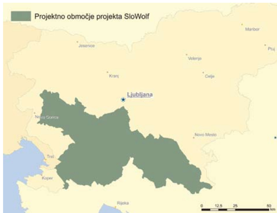
Slika 2: Območje, na katerem bodo potekale aktivnosti projekta SloWolf.

ali medveda, smreko ali plankton. Se pa metode razlikujejo v številnih podrobnostih in morajo upoštevati biologijo posamezne vrste, pa tudi vprašanja, na katera želimo odgovoriti.