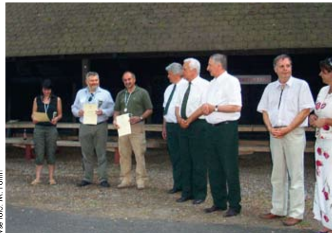
Naša predstavnika sta bila med najboljšimi strelci.