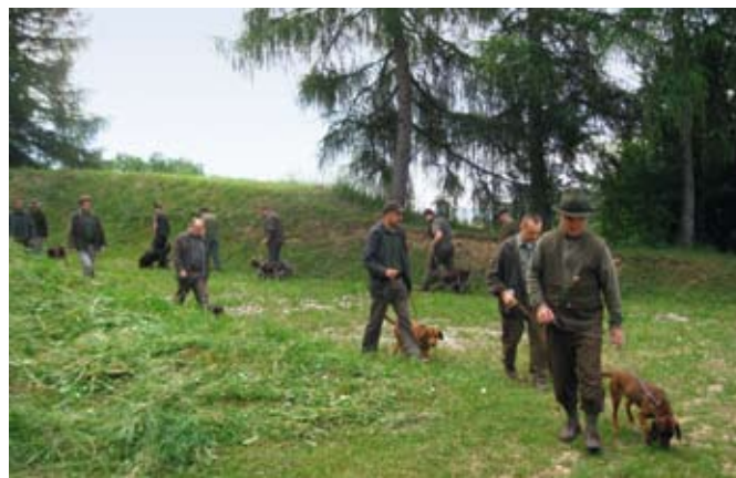
Demonstracija vaje »poleg« – hoja ob nogi na povodcu