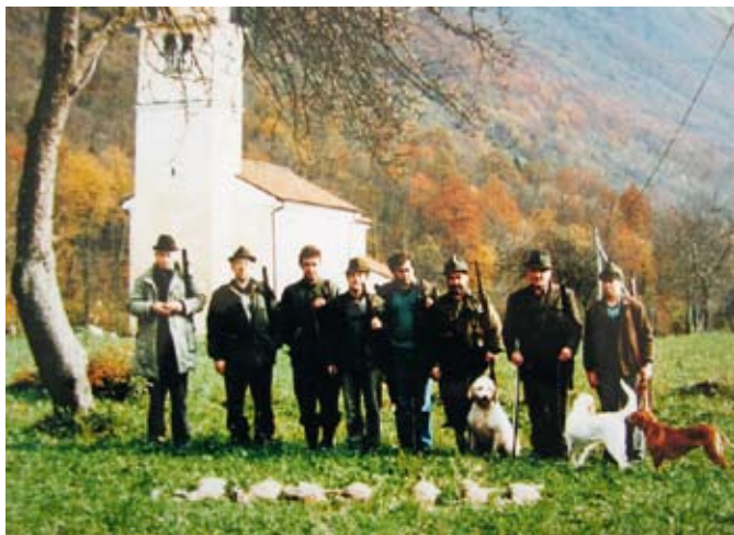
Spomin na brakado v Tolminu 5. 10. 1992, na katero je LD Tolmin povabila tri lovce LD Porezen - Cerknjo s svojimi goniči. Rezultat lova je bil sedem uplenjenih zajcev.

Jelenk) razstavljenih več kot 20 pokalov za ekipne zmage (od prvega do tretjega mesta). Prav toliko pokalov in priznanj so poželi tudi posamezniki in jih odnesli domov ter z njimi razveselili svoje domače.