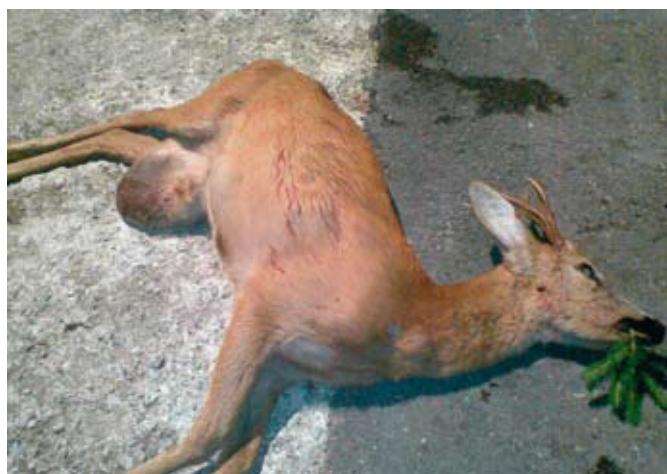
Upljenji srnjak z zelo povečanimi modi

ga triletnega gamsa. Veselje ob uplenitvi prvega gamsa v naši LD je bilo nepopisno. Dogodek