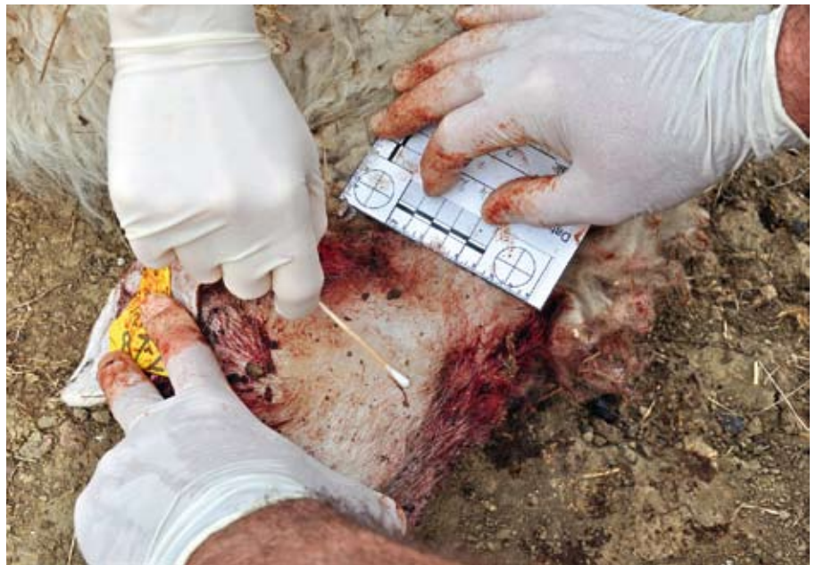
Slika 1: Odvzemanje vzorca sline okrog ugrizne rane na ovci, ki jo je pokončal volk. Vzorce sline bomo jemali na škodnih primerih, ki jih povzročajo volkovi. Tak vzorec nam priskrbi celotni genotip volka, ki je povzročil škodo.

Z molekularno-genetskimi metodami proučujemo DNK, osnovno molekulo življenja, ki pri vsakem živem bitju nosi celoten zapis, potreben za njegov nastanek. Temeljne laboratorijske metode so zato enake, bodisi da proučujemo volka