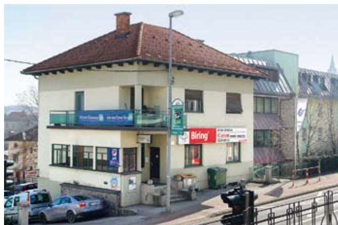
Lovski dom ZLD Novo mesto ima svoj sedež v lastni vili na Seidlovi št. 6, sredi Novega mesta.