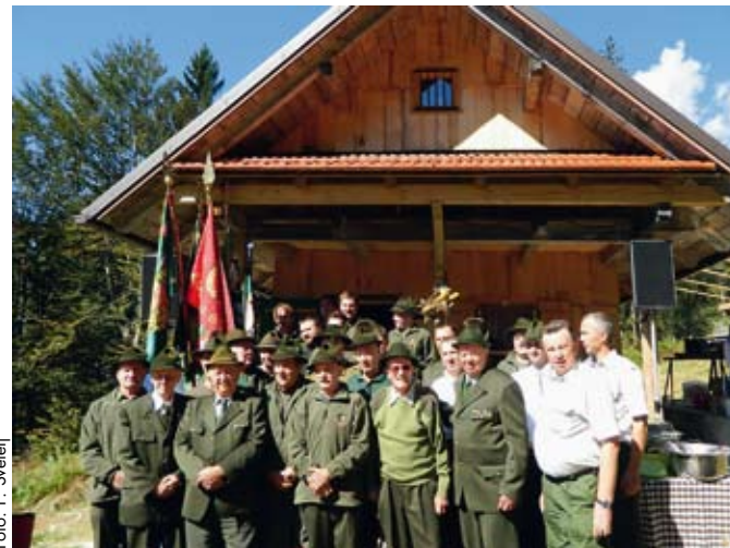
Člani LD Stahovica pred prenovljeno lovsko kočjo na Kališu

V glasilu Lovec so leta 1932, ob 25-letnici Slovenskega lovskega društva (SLD), zapisali: »Zelo živahno socialno življenje je bilo v trinajstem stoletju v Kamniku, v važnem mestu, ležečem na vznožju kamniških planin. Ta kraj, kamor so zahajali koroški knezi in akvilejski patriarhi, je bil