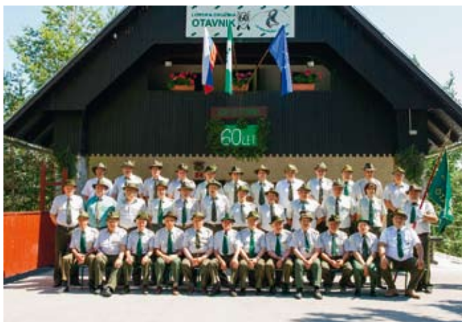
Kolektiv LD Otavnik ob praznovanju 60-letnice svoje LD