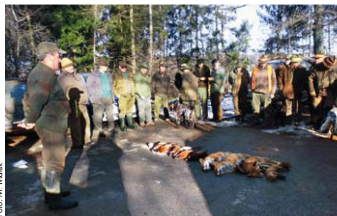
Pozdrav lovini po končanem lovu v LD Starše