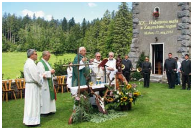
Hubertovo mašo je s spontanim obredom obogatilo kar pet duhovnikov.