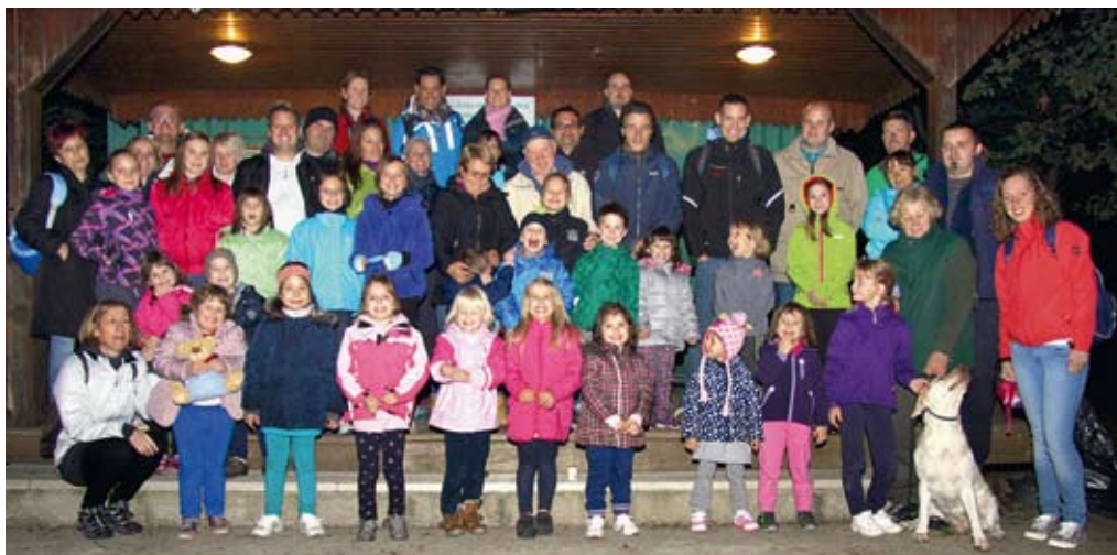
Skupinska fotografija otrok Vrtca Bertoki s starši pred lovskim bivakom na Serminu

Pot nas je vodila čez Stodrež, prek lesene brvi čez reko Dravinjo do Štatenberga in naprej do lovskega doma. Ko smo prišli do cilja, smo kar obnemeli. Tam so nas čakali lovci, ki so pripravili hrano in pijačo. Presenečenje je bilo toliko večje, ker nihče ni vedel, da nas na lovskem domu kaj čaka. Otroci in starši so se najprej na-