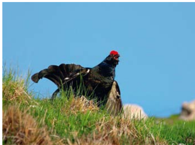
Rušavec s Hoča nad Davčo

na Soči. Neprestano pokanje min je pregnalo gamse v Zapoško in Drnovo nad Cerknim, kjer so kljub zalezovanju lovcev vztrajali kakih dvajset let. Po drugi svetovni vojni se je njihova številčnost neprestano večala vse tja do leta 1980, ko je v naših krajih ponovno dobil domovinsko pravico ris. Zadnjih dvajset let je številčnost uravnovešena, ponekod se tudi rahlo zmanjšuje, ponekod pa povečuje.