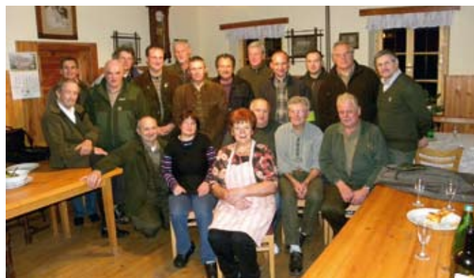
Člani UO LZ Maribor z gostitelji v LD Gaj nad Mariborom

V soboto, 22. 11. 2014, je bil za dve sosednji lovski družini (LD Negova in LD Gornja Radgona) dan posebnega pomena, saj so nadaljevali tradicijo vsakoletnega lova obah LD. Lani je lov potekal v lovišču LD Negova. Dobrim lovskim odnosom in med drugim tudi lepemu vremenu se je treba zahvaliti, da se je pred lovskim domom LD Negova zbralo več