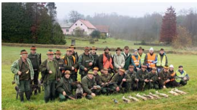
Pozdrav uplenjeni divjadi na tradicionalnem lovu v LD Ormož