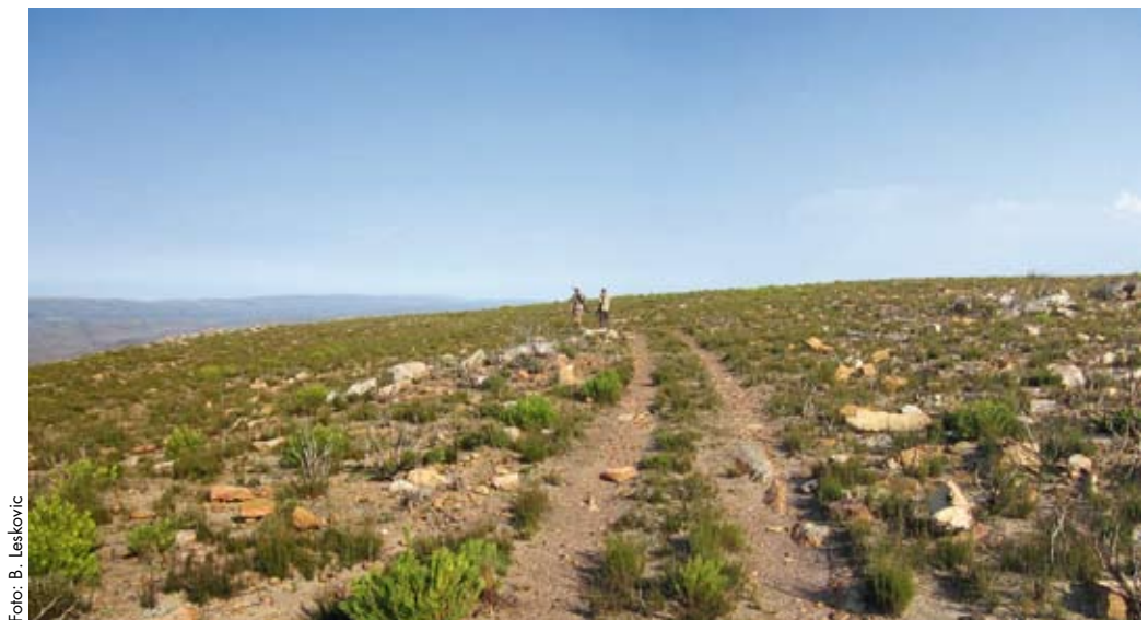
Značilen razgiban habitat Highvelde, kjer smo lovili beločele antilope.

Zdajšnja farmska industrijska reja divjadi na afriških rančih (farmah) je sočasno zelo dobro razvila tudi lovsko dejavnost, še posebno lovski turizem . Zato sta obe dejavnosti tesno povezani in skupaj pomenita pomemben vir glavnih ali dodatnih prihodkov velikih zasebnih lastnikov zemljišč. Veliko je odvisno tudi od velikosti zemljišč in habitatnih tipov (rastlinja) v njih. V letu 1990 je npr. južnoafriška lovsko industrija po grobih ocenah ustvarila 100 milijonov R (južnoafriških randov) prihodka (1 R = 0,089 USD). Okrog 37 % ocenjenega prihodka od lova je redno pristalo