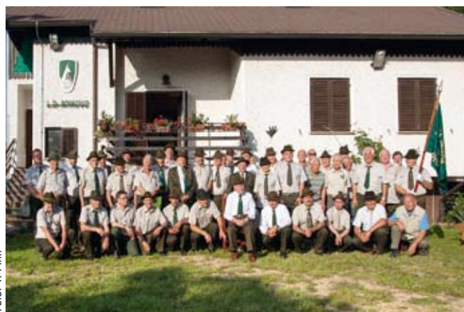
Člani LD Anhovo pred svojim lovskim domom

V tistih časih je bilo stanje v lovišču vse prej kot rožnato, zato so morali lovci krepko zavihati rokave in orati ledino na vseh poljih lovstva. Ena glavnih težav je bilo lovsko izobraževanje.