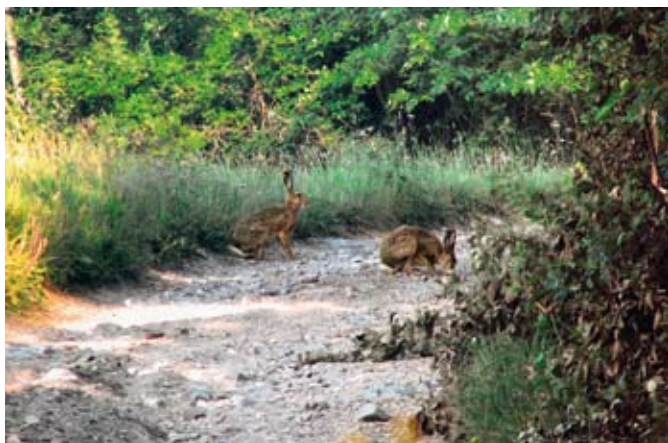
Zajca na Idrijsko-Cerkljanski planinski poti (ICPP)

Med kunami, ki prav tako kot lisica in volk spadajo v širši red mesojedov, pri nas živi kuna zlatica in belica. Sta sicer redki, opazili pa ju bomo v srednje velikih smrekovih gozdovih. Tako kot za jelenjad so tudi za medveda idrijsko-trnovski gozdovi za bivanje in tudi kot selitveni koridor proti Alpam naraven življenjski prostor. Medved in tudi druge velike zveri živijo človeku prikrito življenje. Njihova stalna prisotnost je že običajna, pa tudi njihov značaj