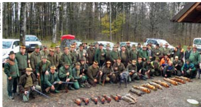
Na tradicionalnem družabnem lovu LD Negova in LD Gornja Radgona ni izostal tudi lovski uspeh.