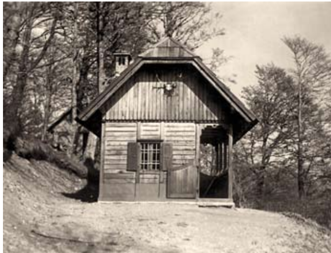
Prvobitna lovška kočica iz l. 1932

čela z deli in postopki za popolno obnovo kočice. Po štirinajstih letih garaškega prostovoljnega dela planincev, občanov, pa tudi nekaterih lovcev so junija 2014 objekt v Hudičevem borštu slavnostno odprli. Tako je bilo na Zaplati prvič zgrajeno novo planinsko zavetišče z uradnim statusom planinske postojanke in enako z