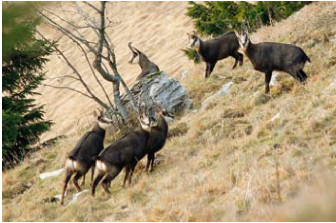
Trop gamsov v Plazeh (LD Porezen - Cerkno)

prehodnih gostov, kar so potrdile številne telemetrične raziskave, ki so potekale v zadnjih dvajsetih letih na našem območju. Uravnavanje številčnosti medveda je v pristojnosti odločitev Vlade Republike Slovenije oziroma pristojnega ministrstva.