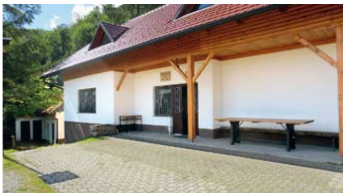
Najlepše urejen lovski dom na območju LZ Maribor v letu 2014 je bil dom LD Poljčane.

Na oceno lovskega doma je vplival predvsem lovski videz (slog) njegove notranjosti. Tako so zlato vidro prejele štiri LD, srebrno štiri, bronasto pa osem LD. Priznanja Lovske zveze Maribor za njihovo delo bodo izročena na občnih zborih lovskih družin, izročali pa jih bodo člani UO Lovske zveze Maribor.