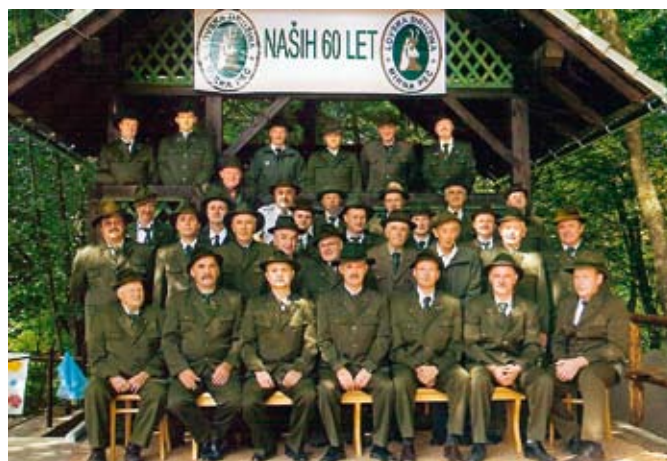
Člani LD Mirna Peč

1 Publilij Sirus: ubi concordia, ibi victoria