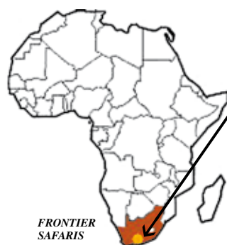
Rezervat Frontier Safaris, kjer smo lovili, je v vzhodnem delu Kapskega polotoka, na skrajnem jugu Afrike in v bližini pristanišča Port Elizabeth.

Potomci belih kolonistov so ostali manjšina med izvornimi Afričani. Kljub temu so belci dolgo ohranjali svojo nadvlado z vrsto surovih apartheidskih zakonov, ki so deželo delili na rasni podlagi. Sistem apartheida je v drugi polovici 20. stoletja naletel na vse večje nasprotovanje tujine, kar je