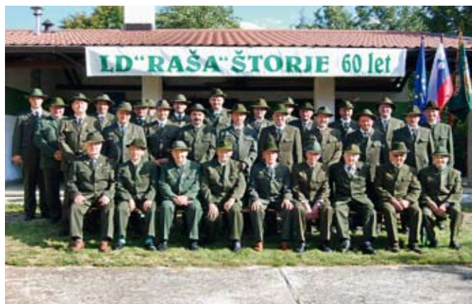
Skupinska fotografija članov LD Raša - Štorje ob 60-letnici

Na predlog Stanka Uršiča so izvolili upravni in nadzorni odbor ter komisijo za razmejitev lovišč z LD Tabor - Sežana, LD Senožeče,