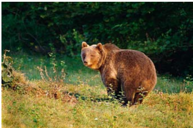
Medved z Zapoške planine pod Poreznom

Glavni cilji v preteklosti in sedanjosti so v loviščih upravljavk, ki so članice idrijske lovske zveze, usmerjeni v upravljanje s prostoživečo divjadjo v najširšem pomenu. Eden od temeljnih načel je, da lovci z divjadjo upravljamo na sodobnih načelih trajnostne rabe. Poseganje v populacije divjadi temelji na načelu, da iz narave vza-