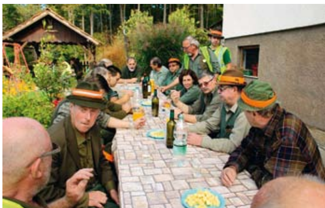
Sproščen klepet ob malici pri Vajngerlovih v Stanetincih

so se lovci za konec zbrali še na zadnjem pogonu v lovskem domu v Dobravi, kjer so se zadržali do večernih ur. Pokrovitelj srečanja je bila Tovarna bovdenov in plastike iz Lenarta (TBP, d. d.), kar je dokaz dobrega sodelovanja LD Dobrava tudi z gospodarskimi družbami.