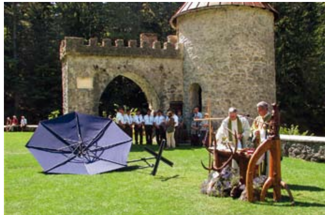
Na eni od prejšnjih prireditev so poskušali z anteno vzpostaviti celo neposredno zvezo z Nebom.

be z liturgičnim zvokom. Bach, Hayden, Beethoven, Mozart in nekateri znani romantiki so ustvarili mnoge večne umetnine. V Nemčiji so s tradicijo lovskih maš začeli v drugi polovici 20. stoletja, torej po drugi svetovni vojni. Tudi Čehi in Avstrijci so nadaljevali s to tradicijo. Žal je z usihanjem plemiškega lovstva zamiralo tudi igranje na lovske rogove. Zamrlo pa ni značilno francosko »zvonjenje« s treslajočimi toni velikih parforsnih rogov. Velike rogove so ustvarili predvsem zaradi njihovih triogelnih